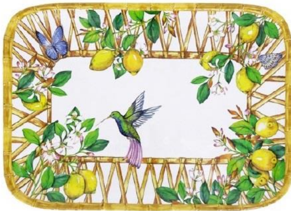
MCA-13MPB : PLATEAU RECTANGULAIRE / RECTANGULAR TRAY 45 x 32 cm / 630 g