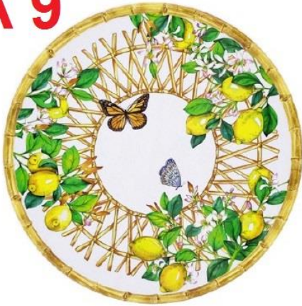
MCA-07PRB : PLAT ROND / ROUND DISH Ø 35.5 cm / 380 g