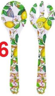
MCA-05C : COUVERTS À SALADE / SALAD SERVERS 33 cm / 155 g