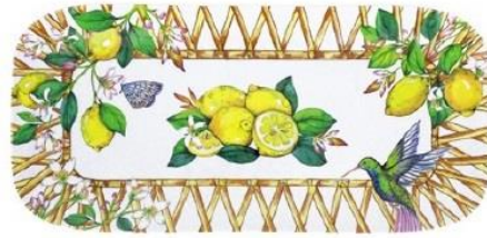
MCA-12PL : PLAT LONG / RECTANGULAR DISH 37.5 x 17 cm / 270 g