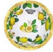
MCA-14BB : PETIT BOL / SMALL BOWL H : 7 cm / Ø 15 cm / 140 g